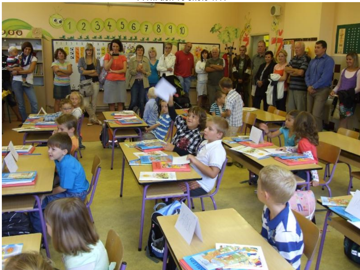
První den ve škole 1. B