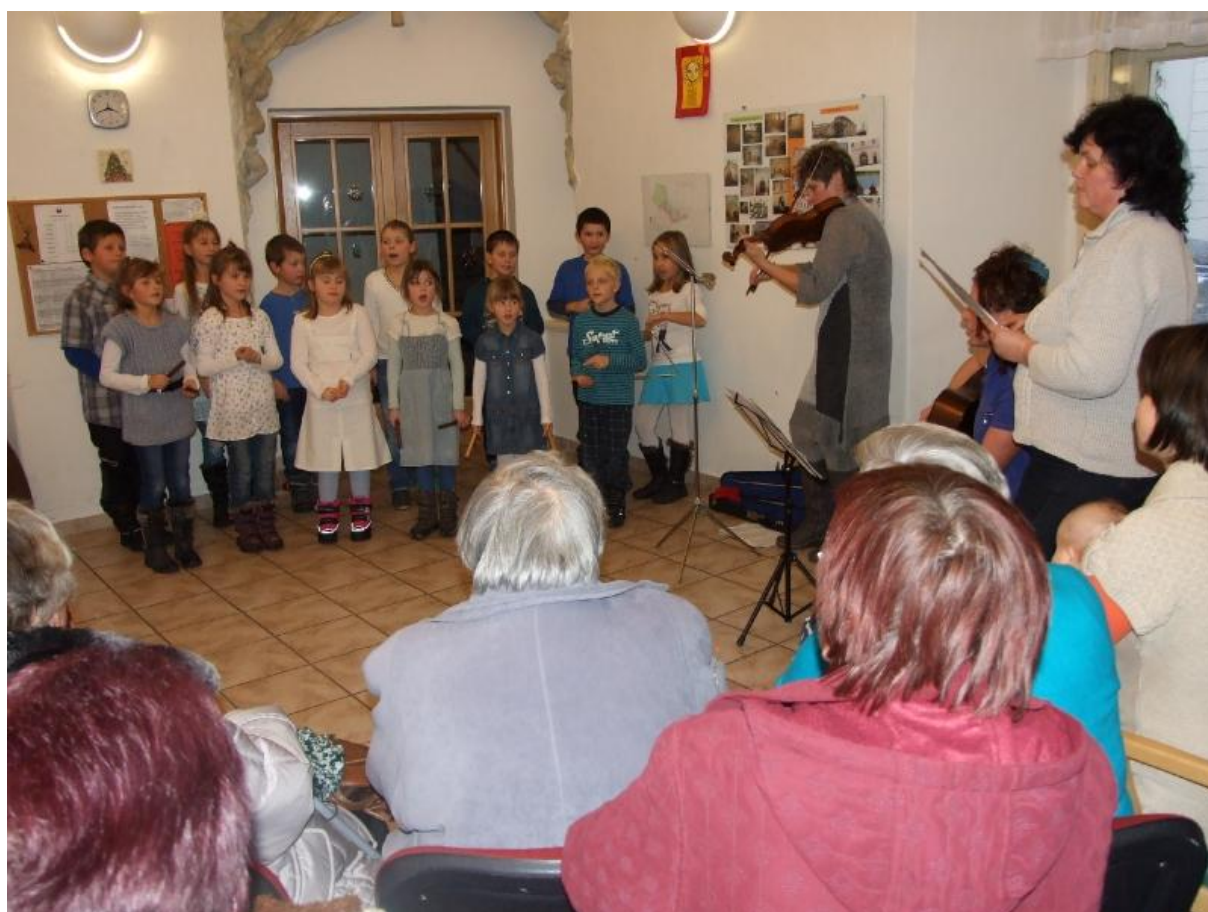
ZŠ Žireč vyučování pro Domov svatého Josefa