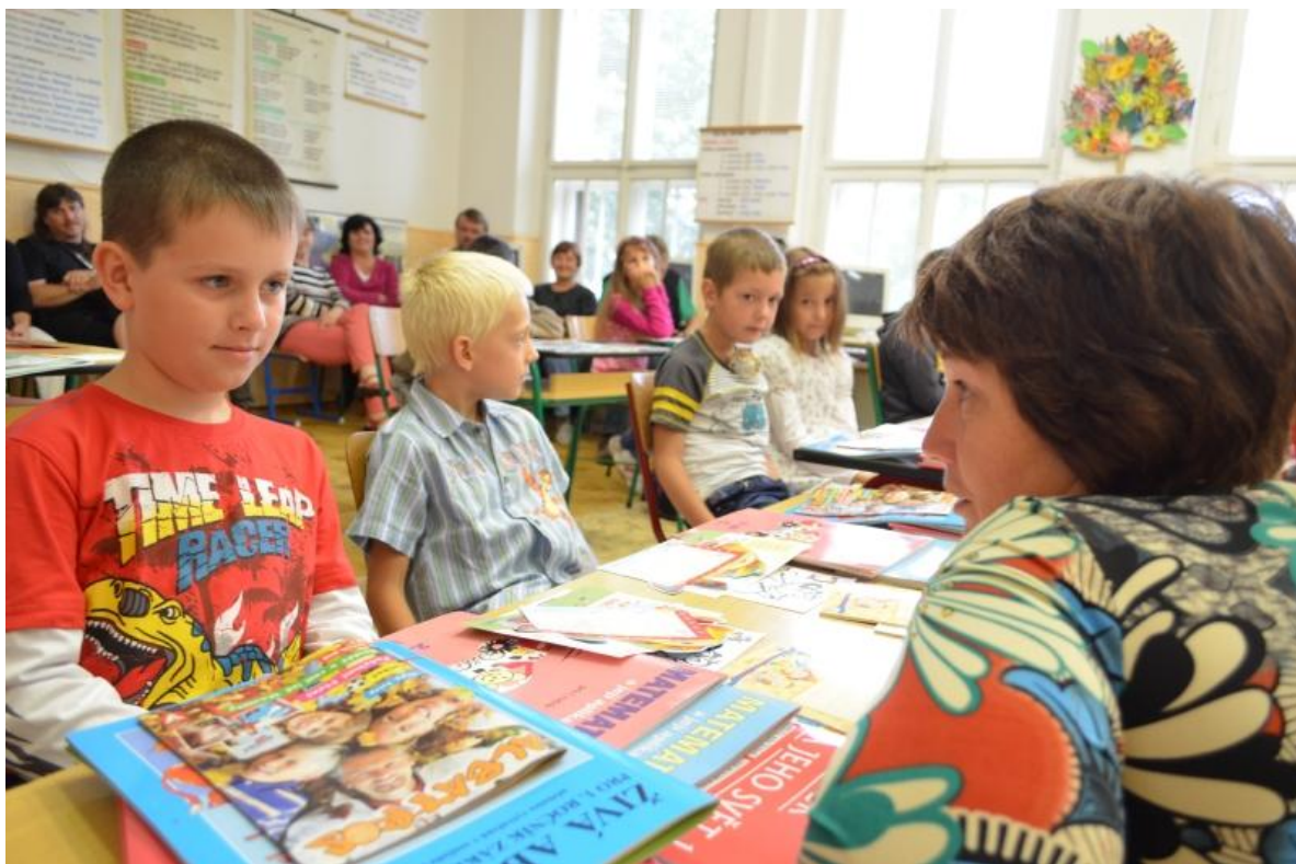
První den ve škole Žireč 1. C