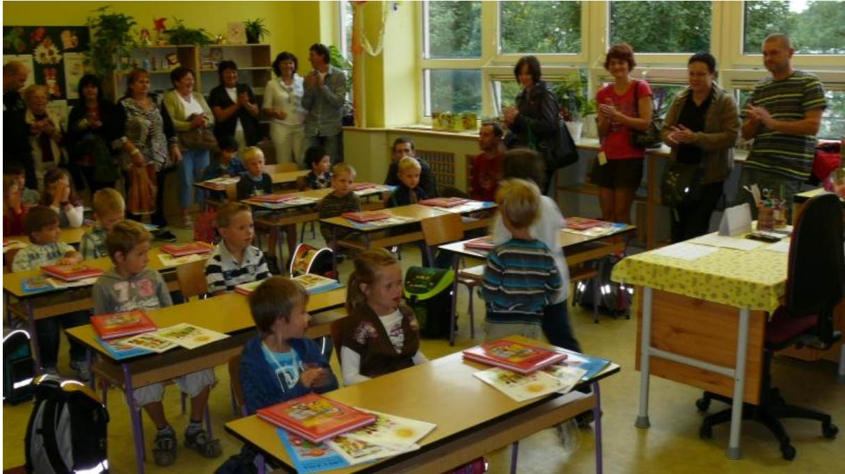
První den ve škole 1. A