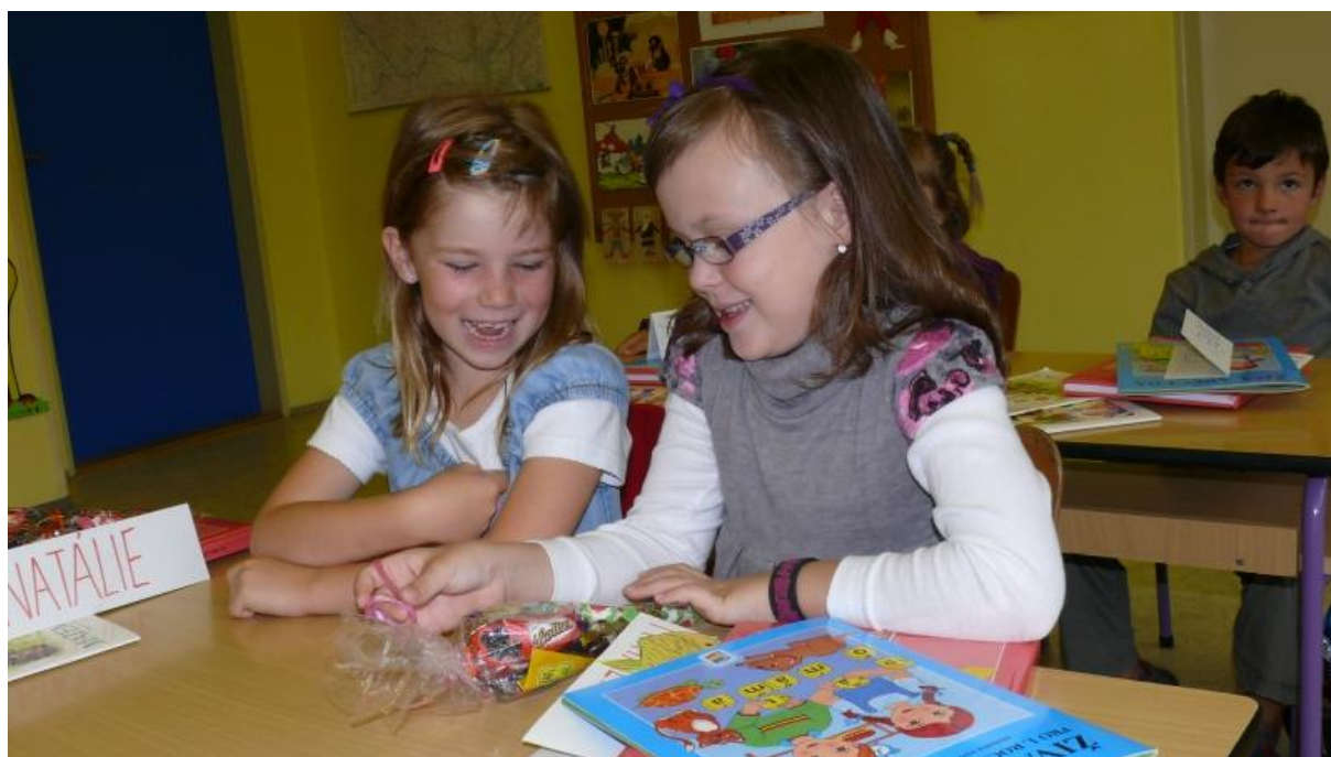
První den ve škole 1. A

Těmito způsoby se snažíme příznivě ovlivňovat klima školy a tříd, aby tzv. skryté kurikulum působilo pokud možno v souladu s tím oficiálně proklamovaným.